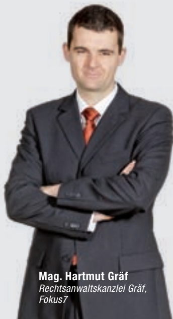
Mag. Hartmut Gräf Rechtsanwaltskanzlei Gräf, Fokus7